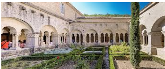
Abbaye de Sénanque, cloître